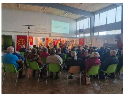
Les Galejaires - Macarelada 21/02/2026