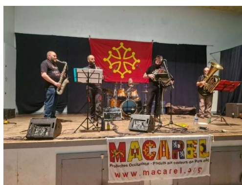
La Peiro Douso - Macarelada 21/02/2026