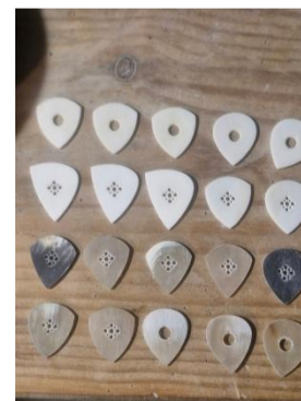
Plectres de còrna