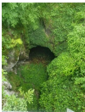
Le Trauc dels Corbasses

Un còp assadolats, una passejada digestiva s'impausèt... Direccion le Trauc dels Corbasses, polit endreit ! L'excursion s'acabèt per la visita d'un talhièr de fabricacion de plectres (mèdiators) de còrna. Una jornada plan agradiva e instructiva !!